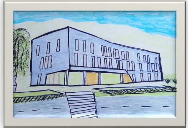
Autor – Adrian Kwaśniak