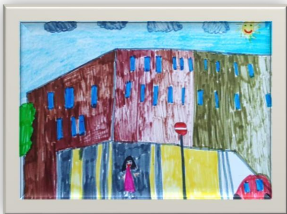
Autor – Agnieszka Bartos