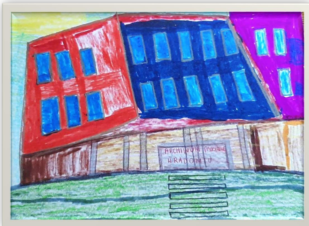
Paca wyróżniona w konkursie. Autor – Jacek Czerwiński