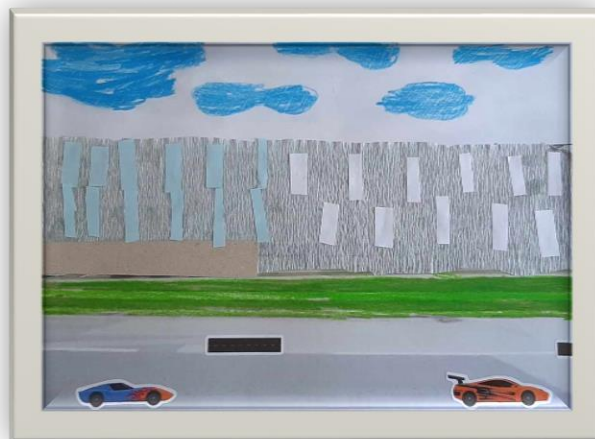
Autor – Mateusz Walczak