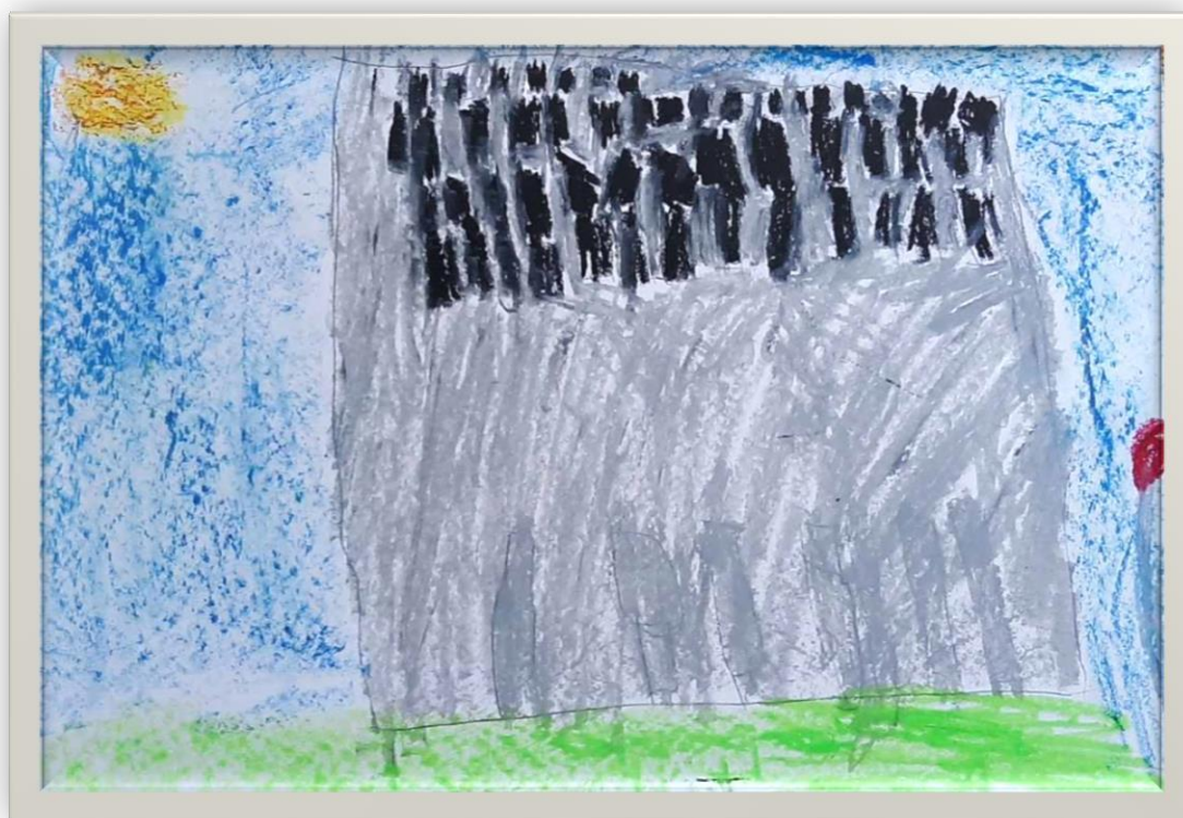
Paca wyróżniona w konkursie. Autor – Ksawery Snarski