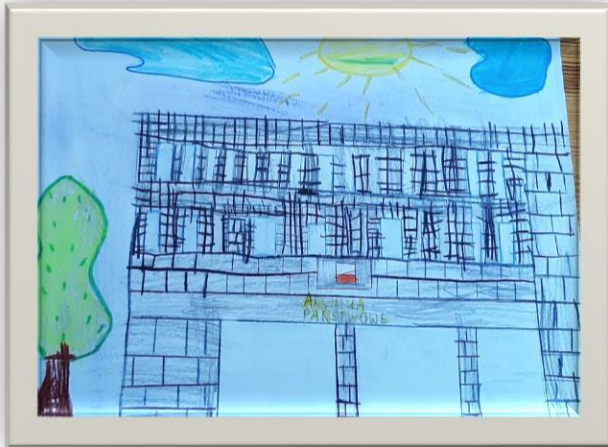
Autor – Sebastian Kwaśniewski