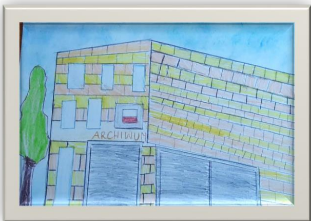
Autor - Szymon Wójcik