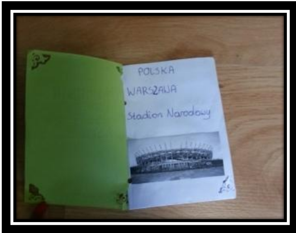
Praca wykonana przez ucznia Oskara Kwietnia