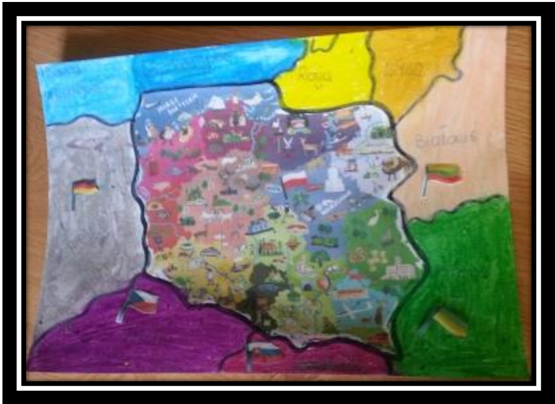
Praca wykoanana przez uczennicę Anitę Rylską